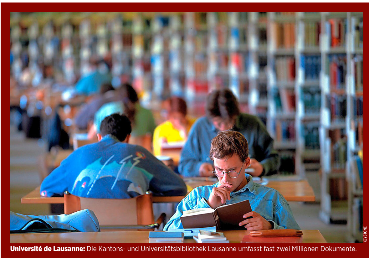
Universität de Lausanne: Die Kantons- und Universitätsbibliothek Lausanne umfasst fast zwei Millionen Dokumente.

Die Verdienstchancen unterscheiden sich nach gewählter Studienrichtung erheblich. So erhält ein dreissigjähriger Student, Fachrichtung Betriebswirtschaft, im letzten Studienjahr 79 500 Franken, drei bis vier Jahre nach dem HF-Abschluss einen durchschnittlichen Jahreslohn von 101 600 Franken. Im Alter von 39 Jahren und mit rund neun Jahren Berufspraxis sind es 126 400 Franken. Ein Student der Elektrotechnik hingegen verdient im letzten Studienjahr 79 200 Franken, nach drei bis vier Jahren 87 800 Franken und mit 43 Jahren und 15 Jahren Berufserfahrung etwa 117 800 Franken. 13 bis 17 Jahre nach Diplomabschluss gehören die HF-Diplomierten der Fachrichtung Unternehmensprozesse mit einem Durchschnittseinkommen von 129 000 Franken, die bereits